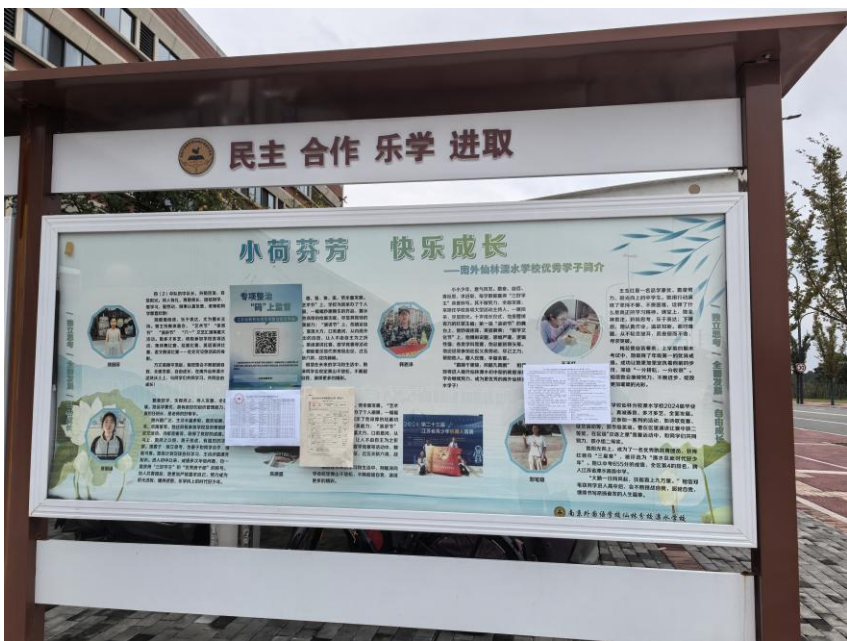
南外仙林溧水学校