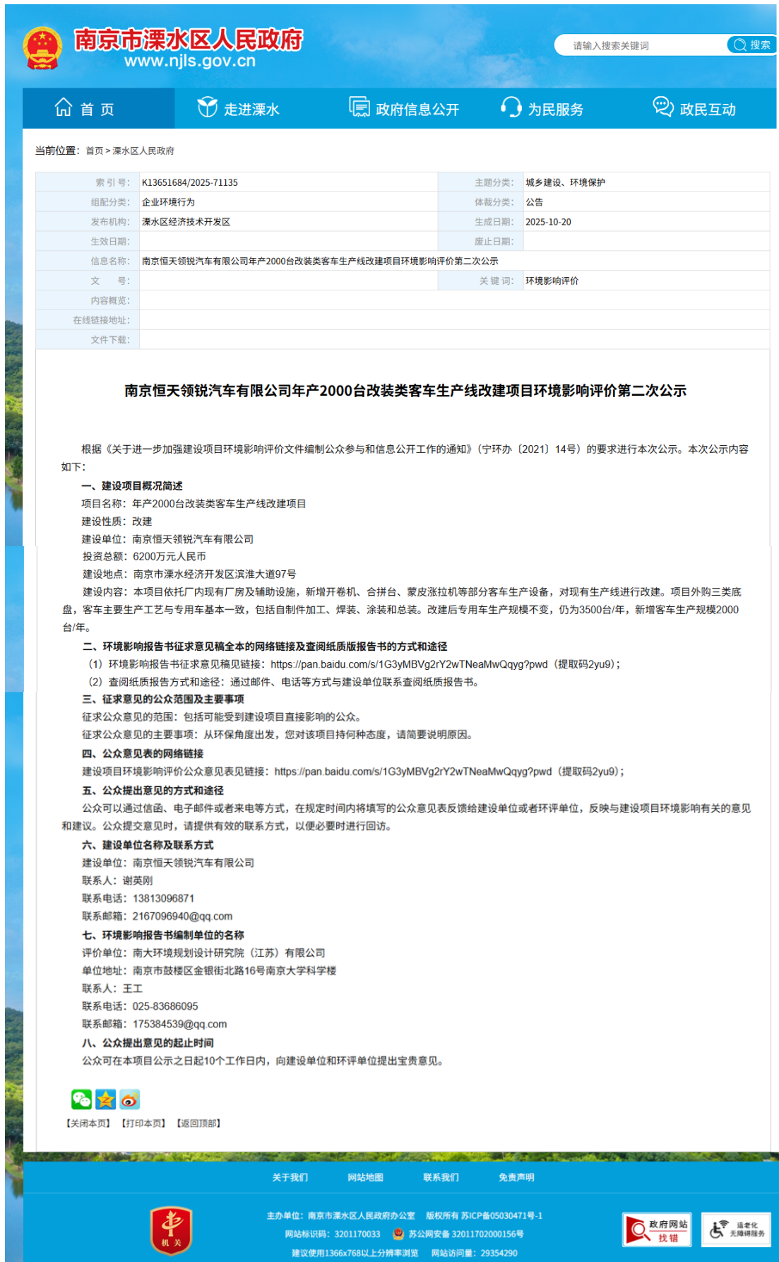
图 3.2-1 本项目第二次公示截图